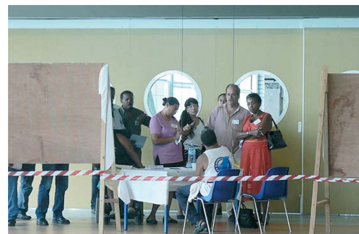
Atelier recherche d'information