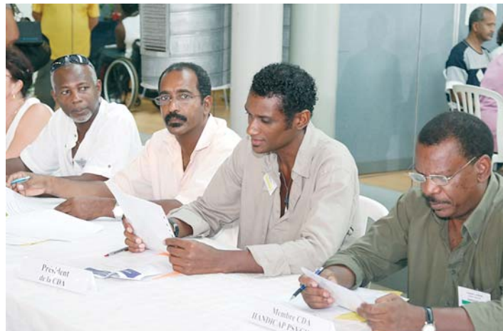
Atelier CDAPH - Commission des Droits et de l'Autonomie des Personnes Handicapées